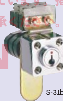
S-3止め金付キースイッチ