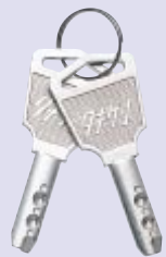
錠前はシャッター付きのリバーシブルキーを使用 内部にパッキン使用