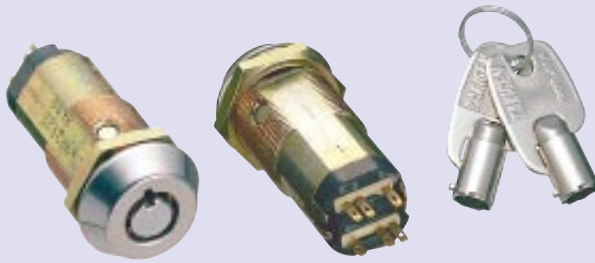
コントロールキースイッチ微小2回路構成 S-18