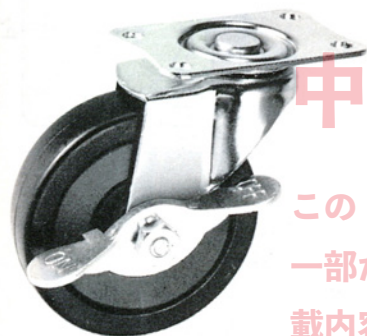
ステンレスフレームもあります。