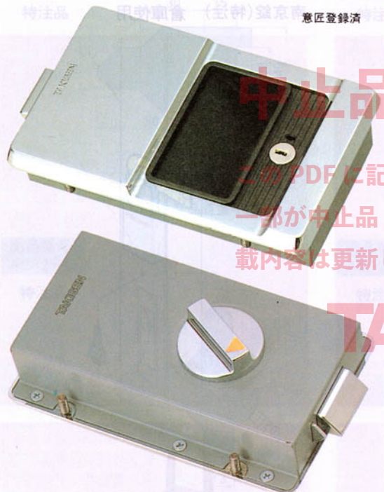
A-258 ラッチ式平面取手