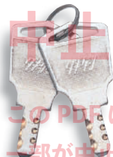
キーNo. JH6420 Key