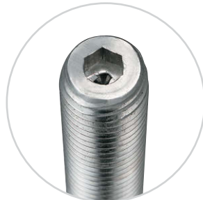
ボルト先端部が六角穴タイプもあります。