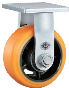
K-543K-150-UR 固定車 Rigid