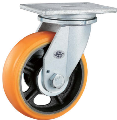
K-544J-200-UR 自在車 Swivel