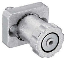
C-1514-C-8 + C-1514-C-8A [皿ねじ用ボルト受け] Flat head screw base