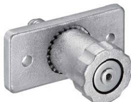
C-1514-C-8 + C-1514-C-8B [なべねじ用ボルト受け] Round screw base