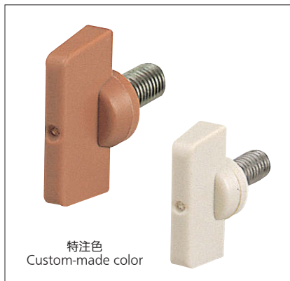
特注色 Custom-made color