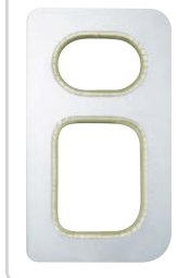
CP-300-BW-1 CP-300-BW-2 CP-300-BW-3