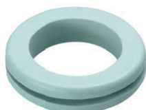
特注 (Green-gray) グリーングレー