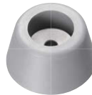
特注 (Gray) グレー