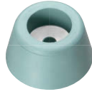
C-30-RK-34-EP-UL-Green-gray (7.5BG7/2相当色) グリーングレー