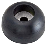
C-30-RK-3617-EP-UL-Black (※1) ブラック