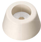
C-30-RK-34-EP-UL-Ivory (2.5Y9/1相当色) アイボリー