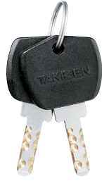
鍵違い Key differences