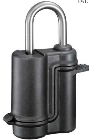
C-587-DL + C-587-DL-RC