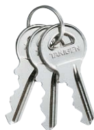
鍵違い Key differences