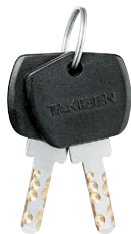
鍵違い Key differences