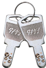
キーNo. D001 Key