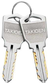
鍵違い Key difference

ストローク14 Stroke 41 30 キー回転範囲 Key turning angle