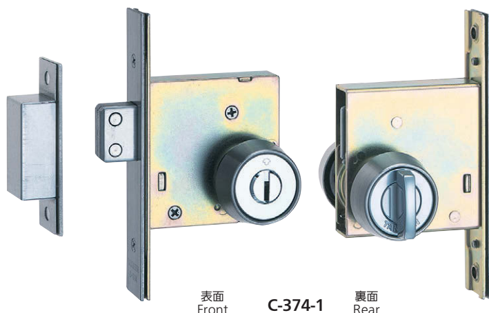
表面 Front C-374-1 裏面 Rear

※写真は錠前組込例です。本製品の錠前は別売です。 ※The photograph shows the product with lock fitted. The lock for this item is sold separately.