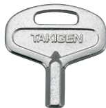
C-174-SH-K 別売 Optional