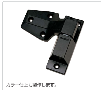
カラー仕上も製作します。