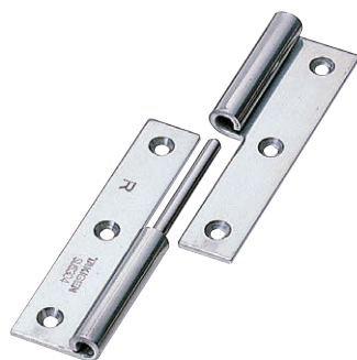
B-1004-1-R (ステンレス製の標準は穴あきです) Standard of stainless steel-made is supplied with hole.