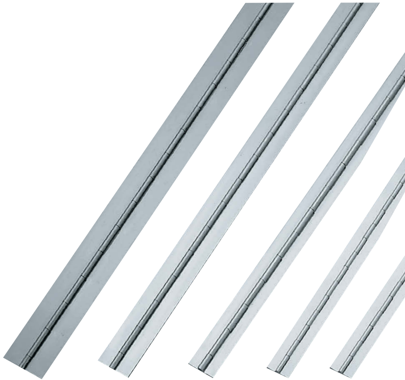
B-1805-161 B-1805-160 B-1805-159 B-805-193 B-805-194