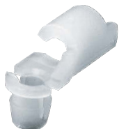
AC-25-Q-11~14 ホワイト White