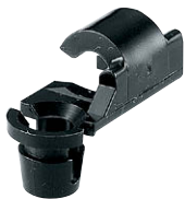
AC-25-Q-1~4 ブラック Black