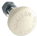
AP-38-2-Ivory (特注色) アイボリー (custom-made color)