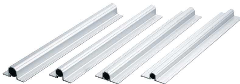
FA-815-G-1 FA-815-G-2 FA-815-G-3 FA-815-G-4